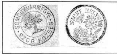
RÉGI PECSÉTEK LENYOMATA